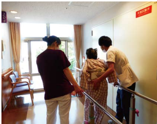
看護師と一緒にリハビリ訓練

地域包括ケア病棟の役割の一つに在宅復帰支援があります。看護師は、入院前の生活に戻ることができるよう、患者さんを「生活者」として捉え、AD