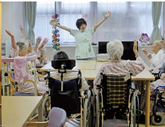
レクリエーションでの体操