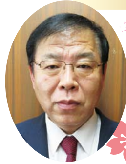
経営管理委員会会長