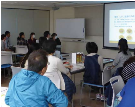
ケアマネカフェの様子