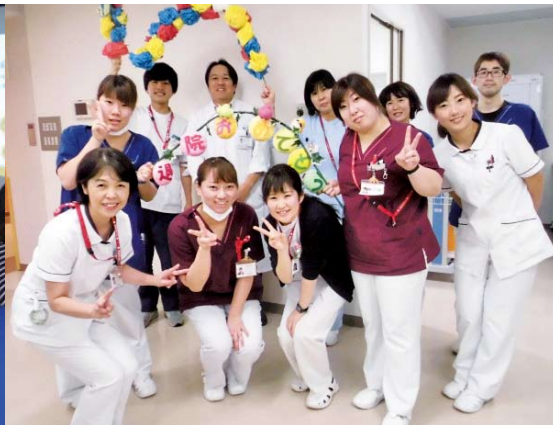
「退院おめでとうアーチ」で見送ります

Lや利用していたサービスなど、自宅での生活状況を具体的に聞き取りしています。理学療法士と共にADLを確認し、セラピストによる訓練とナースリハビリを行うとともに、ADLの維持向上が図れるよう取り組んでいます。