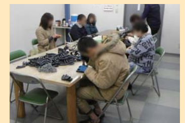
軽作業部作業風景

また作業だけではなく、季節ごとの行事や誕生日会など交流を深めるために月1回レクリエーション活動を企画しています。