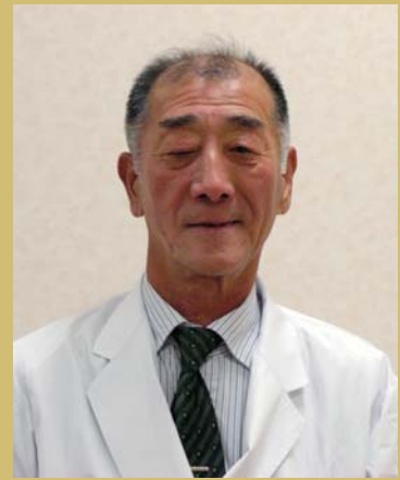
三重県厚生連 鈴鹿厚生病院