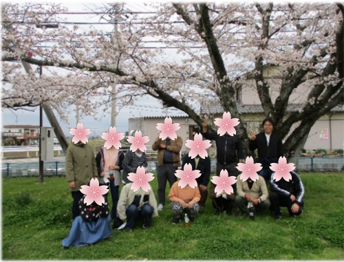
満開の桜の木の下で、記念撮影