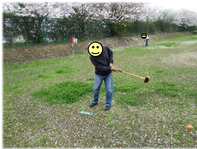
蒸し暑いくらいの気候でした。桜がとってもキレイでした。