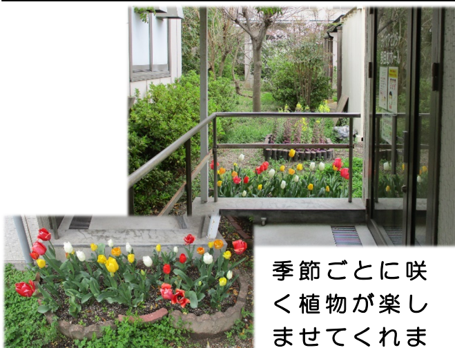
季節ごとに咲く植物が楽しませてくれます。

中庭には東屋があり、フリータイムなどにそこでゆっくりと過ごす方もいらっしゃいます。