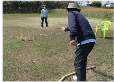
みんなの応援がうれしいです。

デイケアではチューリップなどの花たちが咲き、メダカや金魚が優雅に泳ぎ、冬眠から覚めた亀たちも元気に活動を始めています。今回は「春が来た♪」をテーマに、紙面を新聞風にアレンジしてご紹介しま