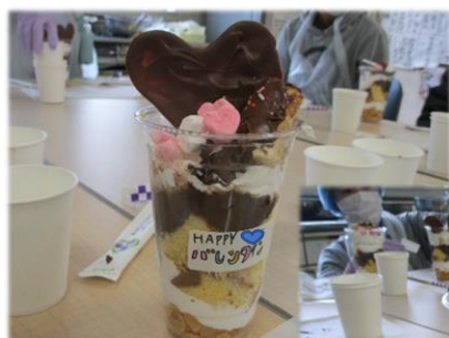
甘々の「自分チョコパフェ」が完成しました!