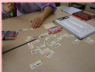
メッセージシールも作りしました。

午前は「下ごしらえ」のプログラムで、トッピングを分けたり、マシュマロの数を数えて1人分ずつに分けたり、バナナを切り分けたりと材料の準備をしました。