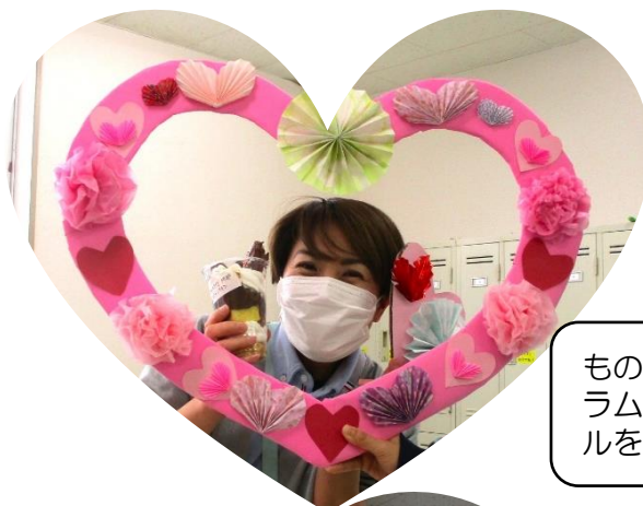
ものづくりのプログラムでハートのパネルを作りました♡