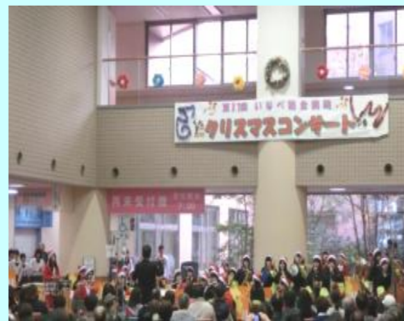
いなべ総合学園高等学校