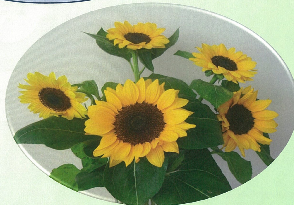
職員が育てたひまわり