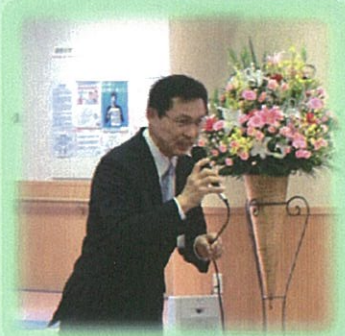
いなべ市長ご挨拶

毎年恒例の病院祭が、10年目を迎え、 このはなコンサートと名称を変え、6月14日(土)に開催されました。