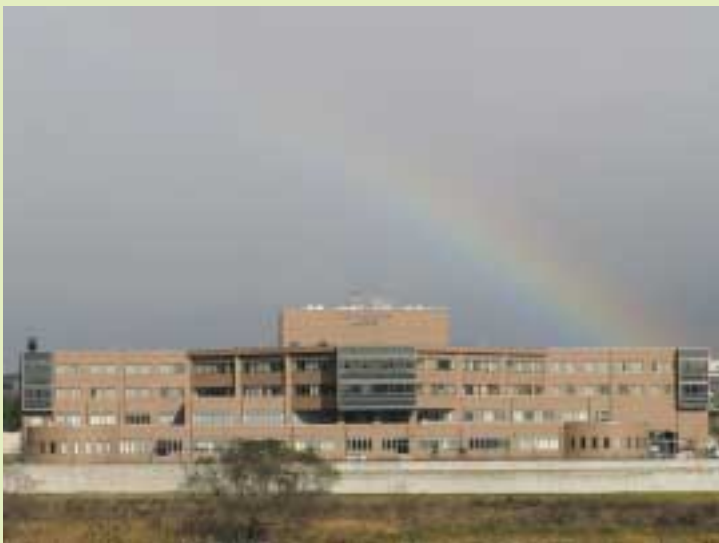
病院に虹の架け橋がかかりました

話題や役に立つ情報を紹介しようと思います。また、これを「架け橋」にして、住民の皆様が開かれた明るい病院をめざしてまいります。この広報誌名「このはなざくら」は、全国に三カ所しかない天然記念物で、この地域に3本もある珍しい「八重山桜」にちなんで命名されたものであります。