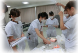
各部署配属・プリセプター 対面