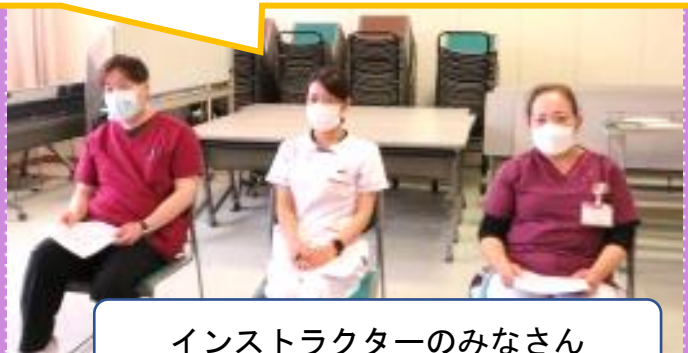
インストラクターのみなさん