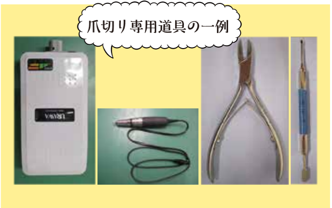
爪切り専用道具の一例

皆さんは普段自分の足をみえていますか？靴を履く時や爪を切る時など、手を見るよりも機会は少ないと思います。足は第2の心臓と言われており、生きていく上でとても大切です。フットケアチームは、巻き爪や分厚くなってしまった爪を、爪切り専用の道具を使用してケアさせて頂いております。ご自身での爪切りや足のトラブルでお困りの方は、当院皮膚科を受診してください。一緒に足を大切にしましょう。