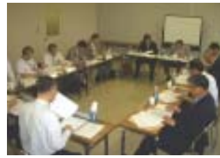
地域連携委員会会議

医療・行政機関とのネットワークを密にして、より顔の見える連携を再認識する事が出来ました。