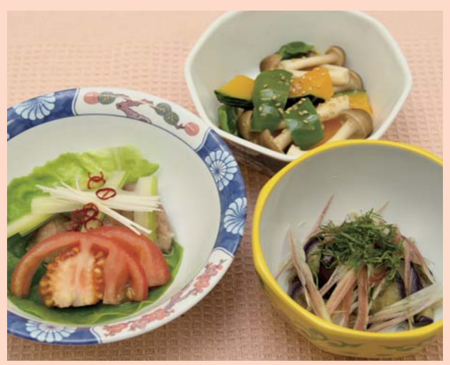
※スペースの関係で誌面での紹介レシピは1品になります。