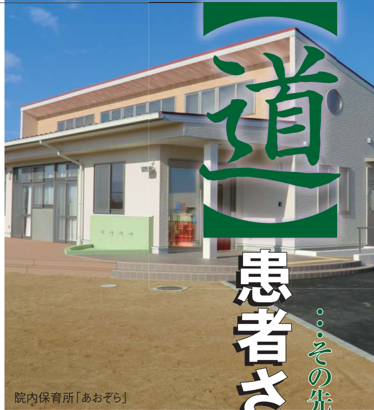
院内保育所「あおぞら」