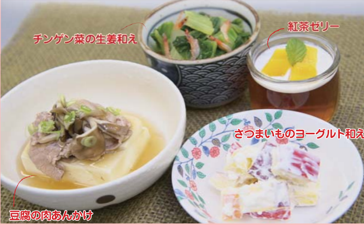
※スペースの関係で誌面で紹介レシピは1品になります。

秋はおいしい食材がたくさん出回る季節ですので、つい食べ過ぎてしまいませんか? 今回の献立では食物繊維の豊富なさつまいもを使ったレシピです。食物繊維は脂肪の吸収を抑えたり、血糖値の急上昇を抑える働きをします。いろいろな食品を使い、バランスの良い食事を心がけましょう。