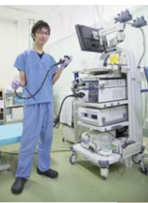
▲ 最新の内視鏡機器 EVIS LUCERA ELITE

以前の内視鏡室と比較し、検査台が3台から4台に増設され、各々の検査スペースも広くなり、患者さまにより快適に検査を受けていただくことが可能となりました。それに加えて7月中旬にはオリンパス社製最新の内視鏡機器 (EVIS LUCERA ELITE) が導入されました。これによりさらに詳細観察が可能となり、早期癌発見と内視鏡治療の向上を行っていく次第です。