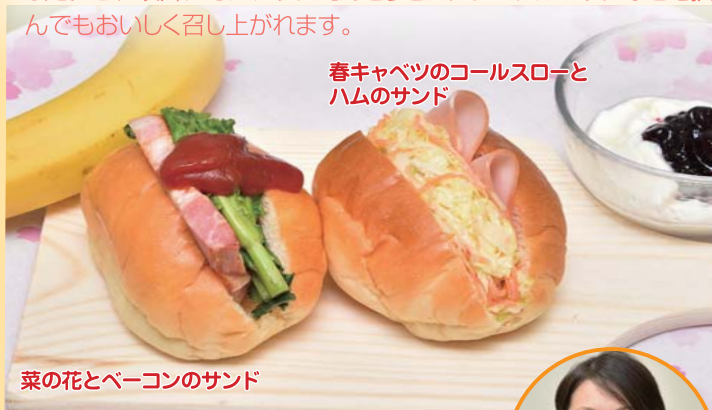
春キャベツのコールスローとハムのサンド

朝食は食べない、食べてもバナナとヨーグルトだけという人も多いと思います。今回は簡単な朝食メニューで春野菜を取り入れてみました。これ以外にもスナップえんどうとスクランブルエッグなどを挟んでもおいしく召し上がれます。