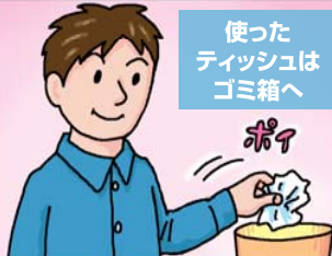
使ったティッシュはゴミ箱へ