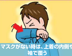
マスクがない時は、上着の内側や袖で覆う