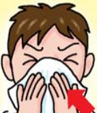
ティッシュやハンカチなどで口を覆う