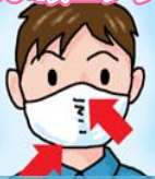
マスクを着用する