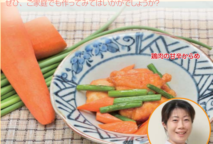
鶏肉の甘辛からめ

今回は、当院の給食の中から人気のメニューをご紹介します。鶏肉の甘辛からめは、その名のとおり絶妙な甘辛さで、ご飯がすすみますよ!作り方もとっても簡単!ぜひ、ご家庭でも作ってみてはいかがでしょうか?