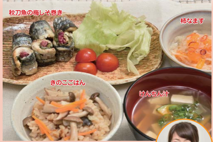
※スペースの関係で誌面での紹介レシピは1品になります。

～秋レシピ～ 秋といえば食欲の秋!秋の食材は、夏の暑さで疲れた体を回復させるにはぴったりです。今回は秋の代表的な秋刀魚を使った料理をご紹介します。外はカリッと中はジューシーに梅と大葉でさっぱりと食べられます♪お弁当やおつまみにもいかがでしょうか。