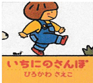
作・絵：ひろかわ さえこ 出版社：アリス館

入園、進級から1ヶ月がたち子どもたちも少しずつ新しい生活に慣れてきました。お気に入りのおもちゃで遊ぶ姿が見られるようになり、笑顔もたくさん見せてくれます。毎日楽しく過ごせるよう体調管理に気を付けながら、安心・安全な保育を心がけていきます。今月は、この季節にピッタリな絵本を紹介します。