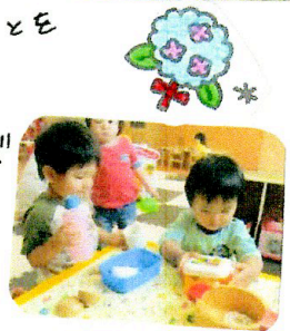
お弁当もできました!!