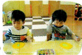
素敵なかたつむりができました!!

戸外でかたつむりをみつけお部屋でクレヨンでかたつむりの製作をしました。「ぐるぐる」と言って模様やたくり模様をしました。お部屋にある絵本を見て「同じ!!」と指さした子もしています。